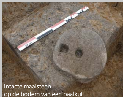
intacte maalsteen op de bodem van een paalkuil