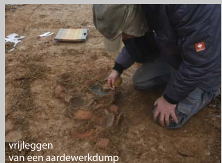
vrijleggen van een aardewerkdump