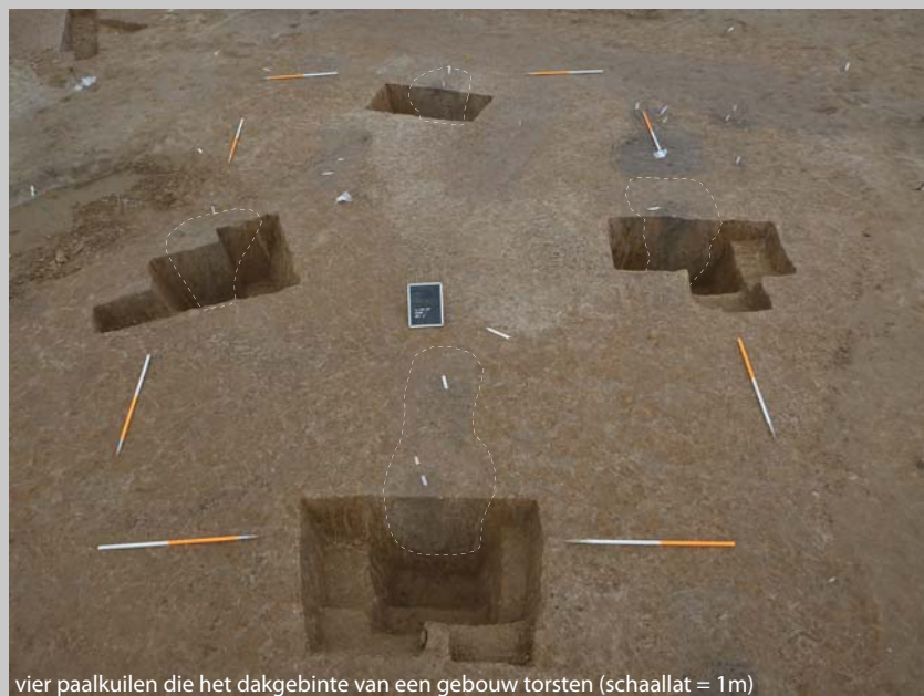
vier paalkuilen die het dakgebinte van een gebouw torsten (schaallat = 1 m)

Ook tijdens deze barre wintertijden gaat het archeologisch onderzoek door te Leeuwergem (Zottegem). Naar aanleiding van de realisatie van het bedrijventerrein Spelaan, gelegen langs de Spelaanstraat te Leeuwergem, voert de Dienst Archeologie van SOLVA sinds vorig jaar een vlakdekkend onderzoek uit. In een vorige nieuwsbrief (19) belichtten we reeds een stand van zaken. De voorbije maanden lag de focus op het onderzoek van de Romeinse woonzone. Daarnaast zijn enkele zones rondom de nederzetting aan bod gekomen waarbij opnieuw verschillende crematiegraven zijn aangetroffen, de getuigen van de dodenzorg van de toenmalige bewoners.